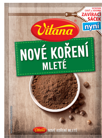
Nové korenie mleté